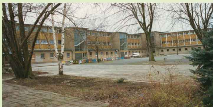
Schulhofansicht um 1995, M. Suckert