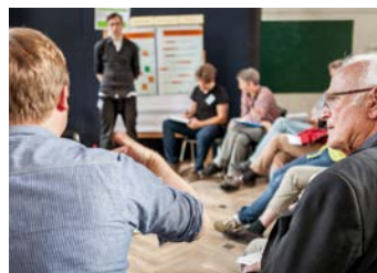
Potsdamer Modellprojekt: Strukturierte Bürgerbeteiligung Abbildung: Philipp Reiss

Die Grundlage dafür bilden die lokalen Gegebenheiten und darauf aufbauend die Handlungsspielräume vor Ort. Gleichzeitig orientiert sich das Konzept an den nationalen Klimaschutzzielen des Bundes. Ein Klimaschutzkonzept zeigt kommunalen Entscheidungsträgern auf, welche Möglichkeiten zur Minderung von Treibhausgasen bestehen und welche Maßnahmen es hierfür umzusetzen gilt. Auf Basis von Analysen werden Ziele auf dem Weg zur Treibhausgasneutralität festgelegt und notwendige Rahmenbedingungen aufgezeigt, um diese Ziele zu erreichen.