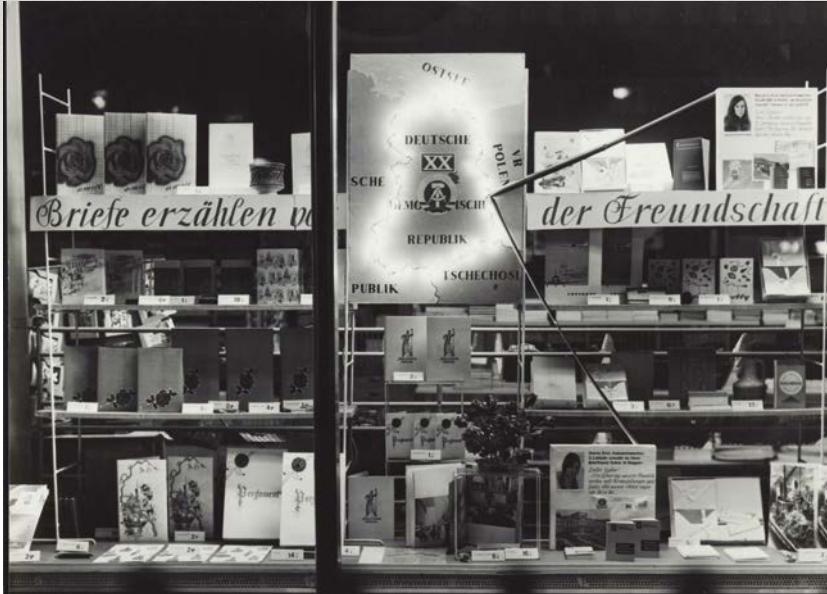
Martin Fricke, 1969

Ergebnisse wurden hin und wieder professionell im Bild festgehalten. Die in der folgenden kleinen Reihe gezeigten Fotos stammen fast aus- schließlich vom Frankfurter Foto- grafen Martin Fricke, welcher in den späten 1960er Jahren auch für das HO-Werbeatelier arbeitete. Wir beginnen unseren Bummel auf der Ostseite der Leninallee, genauer am „Wohnblock 400“ – oder etwas verständlicher – den „geraden“ Hausnummern Leninallee 4 bis 16. Das Motto lautete: „XX Jahre Deut- sche Demokratische Republik“. Viel Spaß beim Entdecken! ■ ■ ■