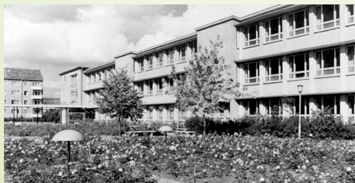
Historische Platzansicht, Timme

Das gesamte Wohnkomplexzentrum mit dem Platz der Jugend und der ehemaligen Schule, steht seit 2020 unter Denkmalschutz. Die kommunalen Sporthallen werden noch immer durch den Vereinssport und die Lehrschwimmhalle wird temporär für Kunst- und Kulturzwecke genutzt. Seit 2021 verfolgt der Verein Schule für Gesundheitsberufe e.V. mit Unterstützung der Stadt Eisenhüttenstadt und zahlreicher weiterer Partner Pläne für eine mögliche Erweiterung seines Schulbetriebes in der ehemaligen Schule V zu einem „Internationalen Bildungscampus Gesundheit“.