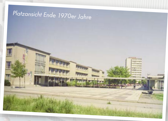
Platzansicht Ende 1970er Jahre