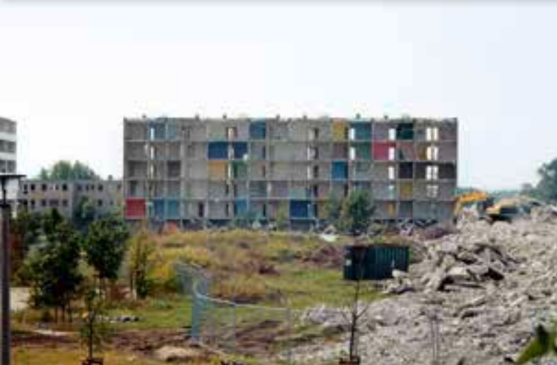
Abrissarbeiten im WK VII