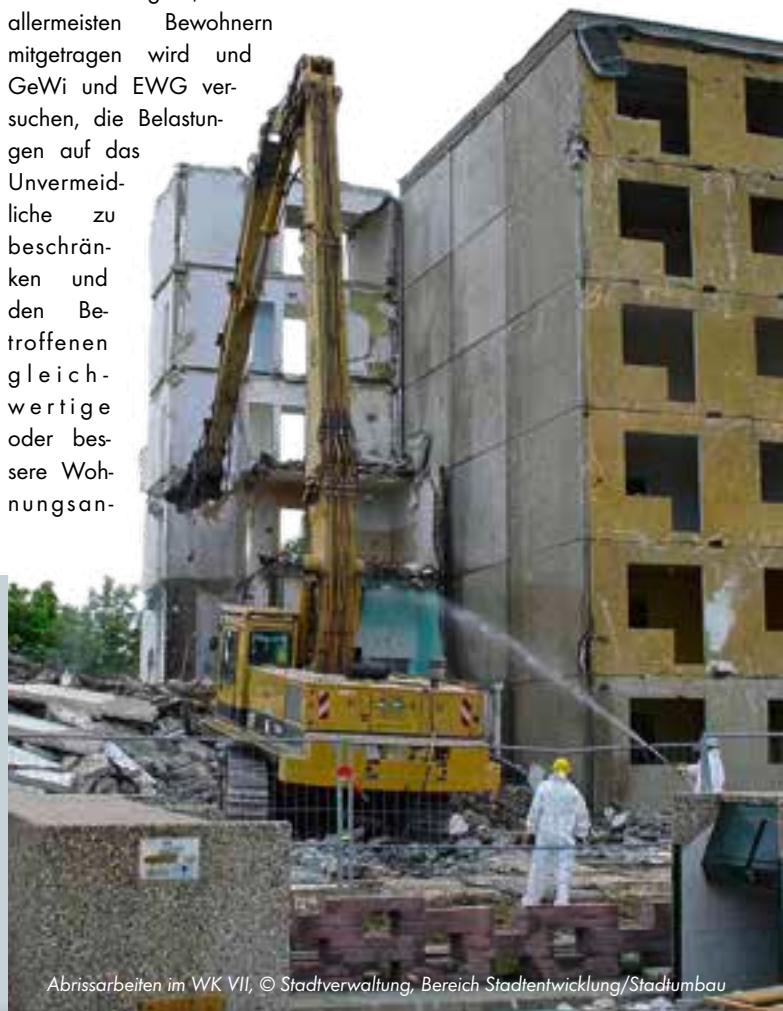
Abrissarbeiten im WK VII

gründete sich die Arbeitsgemeinschaft Stadtumbau u. a. aus der Stadt, den Wohnungsunternehmen und Versorgungsträgern und formulierte unter Zuhilfenahme von Portfolioanalysen der Wohnkomplexe, Mieterbefragungen und dem Stadtumbaukonzept einen gemeinsamen Konsens für die künftige Entwicklung der Stadt. Das dabei so schwere Umstrukt-