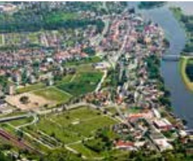
Der VII. Wohnkomplex vor und nach den stadtumbaubedingten Rückbaumaßnahmen