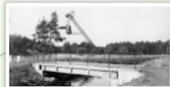
oben: Leinpfadbrücke, im Hintergrund der Maschinenturm des Kabelbaggers, © Archiv WSA Berlin Abz. Fürstenwalde