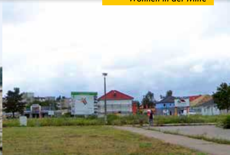
Neubaupotenziale für Eigenheime Fürstenberger Straße

Der Abriss des WK VII leistete einen erheblichen Beitrag zur Reduzierung des Leerstandes in den anderen Stadtteilen. Das Überangebot an Wohnraum konnte entsprechend der Bevölkerungsentwicklung abgebaut und die – durch Leerstand und Altschulden entstehenden – Kosten verringert werden. Weiter wurden durch Stilllegung und Rückbau nicht mehr genutzter technischer und sozialer Infrastrukturen Kosten reduziert und an anderer Stelle investiert.