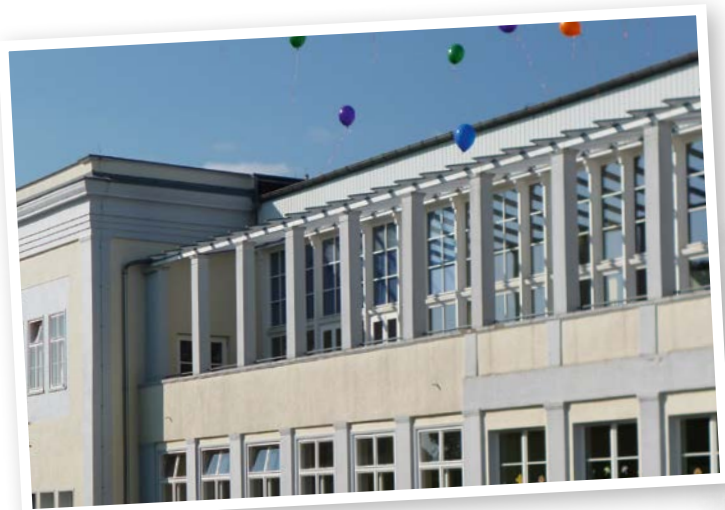
Blick auf die Terrasse mit Pergola

Entwürfe und Ausführungspläne der vier Trinkbrunnen stammen übrigens aus der 1920 von Walter Gropius gegründeten Bauhaus-Keramikwerkstatt in Dornburg. 2023 wurden die Märchenmotive originalgetreu restauriert. Damals wie heute nimmt die liebevolle Flurgestaltung die Schüler mit auf eine Reise in die Grimmsche Märchenwelt und zeigt Darstellungen von Frau Holle, dem Froschkönig, Hänsel und Gretel und den Bremer Stadtmusikanten. Die Märchenbilder und Trinkbrunnen hatten nicht nur damals eine dekorative, orientierungsgebende und identitätsstiftende Funktion. Auch wenn die Brunnen heute leider trocken bleiben müssen, sind sie für die Schüler eine liebgewonnene Gestaltung und über die Jahrzehnte hinweg ein ganz besonderes „Markenzeichen“ der Schule. Die heutige Grundschule „Erich Weinert“ wurde nach den Sommerferien am 1. September 1954 eröffnet. Im Jubiläumsjahr 2024 werden aktuell viele Aktivitäten vorbereitet. Wir dürfen gespannt sein! ■ ■ ■ ■