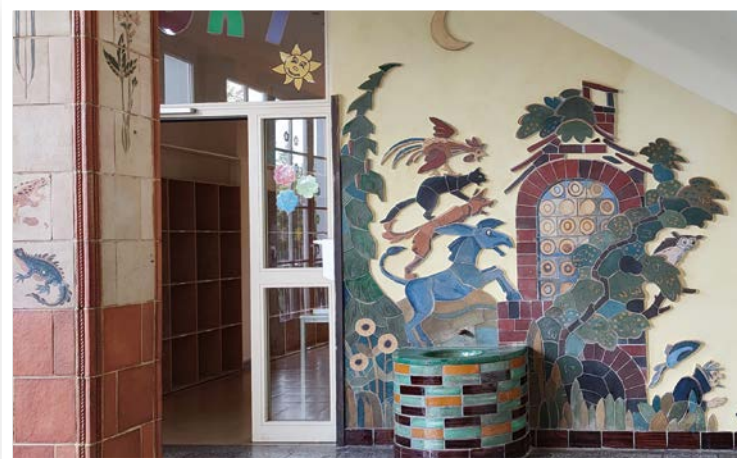
Kunstvolle Säulen und Märchenbrunnen

Leseraum/Bibliothek, Speise- und Ruheräume, Konferenzzimmer sowie ein pädagogisches Kabinett für die Weiterbildung der Lehrer. Zum großzügigen Freiflächenprogramm gehörten Spielplätze, Rasenflächen und Blumenbeete sowie ein „Mitschurin-Schulgarten“. Über die Jahre hat sich die 1954 eröffnete Schule immer wieder neuen Herausforderungen und Veränderungen in der Schulstruktur gestellt. 1965 fand die Namensgebung „Erich Weinert“ statt. Ab dem Jahr 1991 wurde sie von der zehnklassigen Polytechnischen Oberschule zur Grundschule und seit 1996 im Rahmen des Projektes „Schule für Gemeinsames Lernen“ zur Integrations-schule um- und ausgebaut, in der das gemeinsame Lernen auch für körperbehinderte Kinder möglich ist. 1999 gab es in der Schule immerhin noch 24 Grundschulklassen mit 512 Schülern, davon waren 55 Kinder Integrationsschüler. Der Verkehrsgarten eröffnete 2001, dieser wird gern auch von anderen Schulen zu Verkehrsprojekttagen und für die Fahrradprüfung genutzt. Nach der großen denkmalgerechten Sanierung aller Gebäudeteile mit Dach, Fassade, Fenstern und Türen im Jahr 2000 ist 2005 auch der Schulhof neu gepflastert worden. Nach einer weiteren Überarbeitung der Holzfenster im vergangenen Jahr folgen nun hauptsächlich verschiedene brandschutztechnische Maßnahmen.