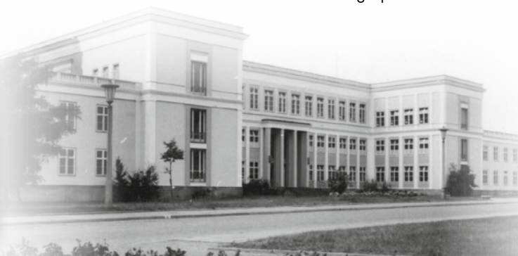
Historische Straßenansicht um 1955