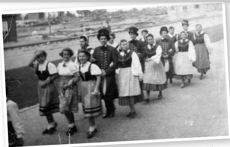
Erste Tanzgruppe, 1951 / Erkennen Sie sich? Dann melden Sie sich bei uns.