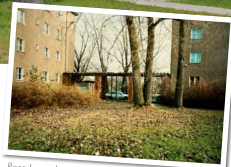
Rosa-Luxemburg-Straße vor und nach dem Umbau

Im Stadtteilbüro offis wird am 4. Juni im Rahmen der Informationsveranstaltung „offis am Dienstag“ auf die sichtbaren und spürbaren Veränderungen unserer Stadt im Zuge des Stadtumbaus zurückgeschaut – anschaulich untermalt durch die neuen Kurzfilme. Außerdem werden die Filme auf der Website und den Social-Media-Kanälen der Stadt veröffentlicht. ■■■